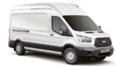
BLANCO OXFORD - 3GZ